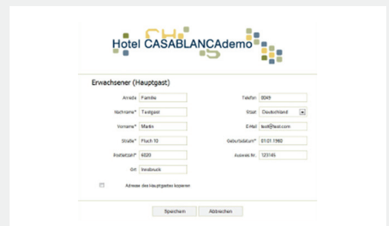
>> GuestExchange Online Formular