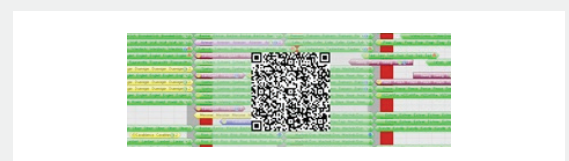
>> QR-Code Funktion am Zimmerplan

Das Gespräch mit Ihnen ist uns wichtig. Sollten Sie noch weitere Fragen haben.