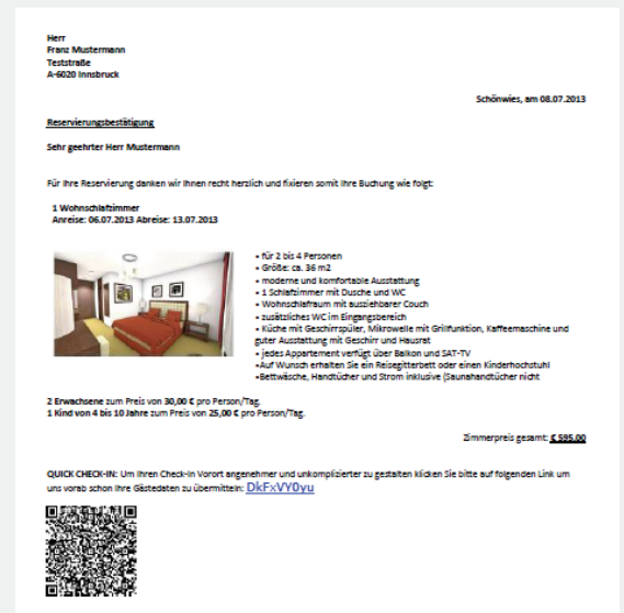
>> Reservierungsbestätigung mit Link zum GuestExchange mit QR-Code